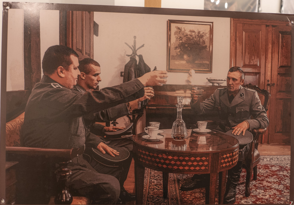
Narada funkcjonariuszy Służby Bezpieczeństwa SS. Berlin, 5 lipca 1939 r.