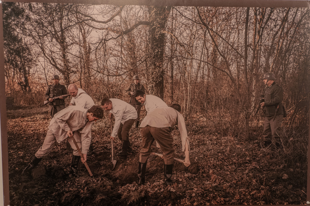
Kopanie przez młodych Polaków masowego grobu na cmentarzu w Książu. Książ, 20 października 1939 r.